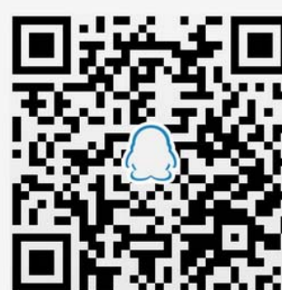
学生交流服务QQ群 543672438 ( 点此加入 )