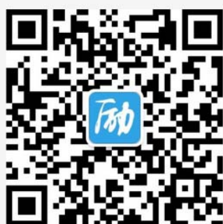
微信公众号 “励志君APP”