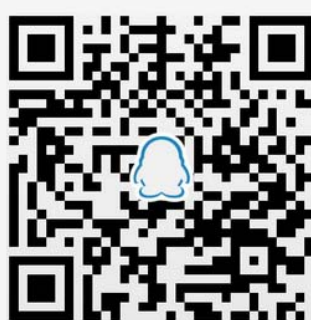
教师交流服务QQ群 543528101 ( 点此加入 )