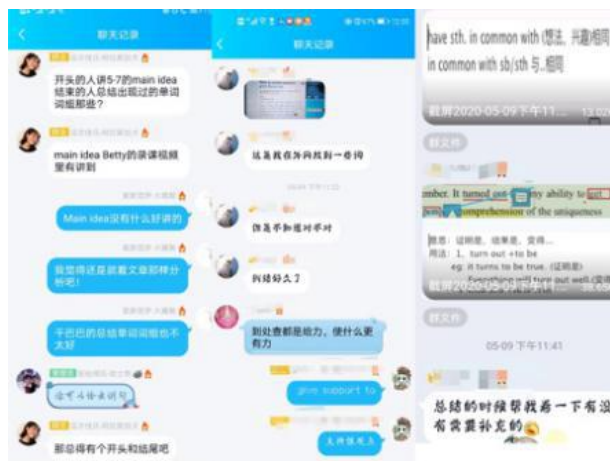
图 2 丰富热烈的小组讨论