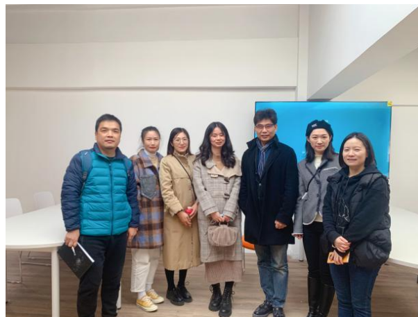
何明教授与学生互动现场